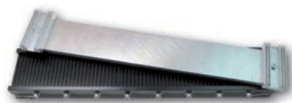
Formschuh für Zahnriemen

Standard Formschuhe für PU und TPE Rund- und Keilriemen. Andere Größen auf Anfrage.