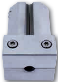
Formnest für Rundriemen