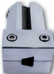
Formnest für Keilriemen