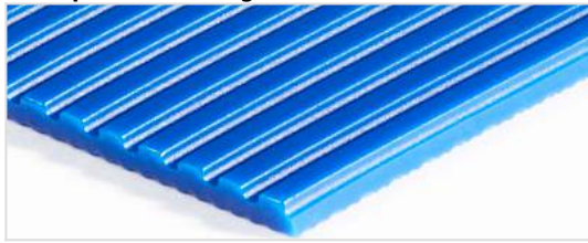
Transportseite: Längsrillen (LGB)