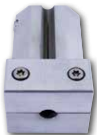
Formnest für Rundriemen