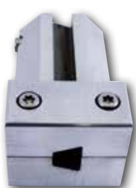
Formnest für Keilriemen