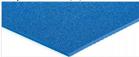
Transportseite: Feinrau (SR)