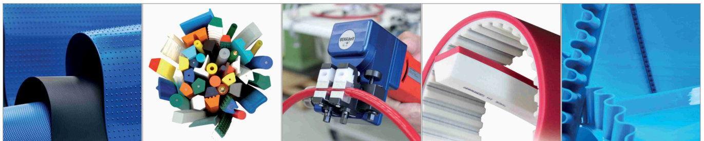
Monolithische Transportbänder aus PU und TPE

Ergänzende Produktlösungen sowie Schweiß- und Verbindungstechnik.