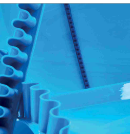
Akcesoria do pasków PU