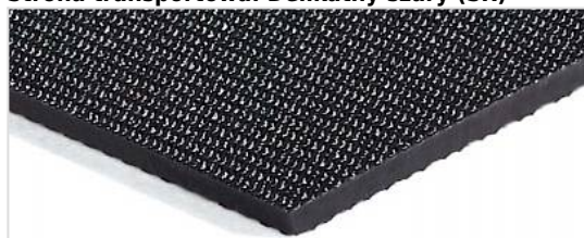
Strona transportowa: Delikatny szary (SR)