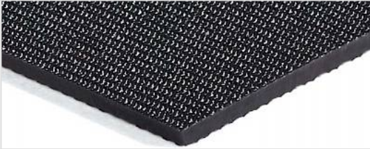
Transportseite: Feinrau (SR)