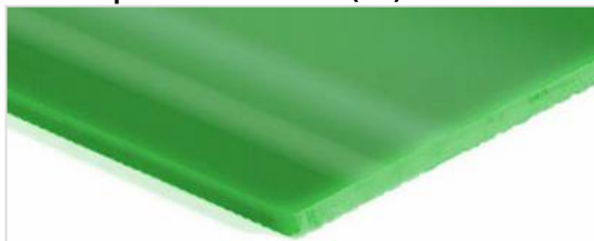
Lato trasporto: Liscio lucido (SG)