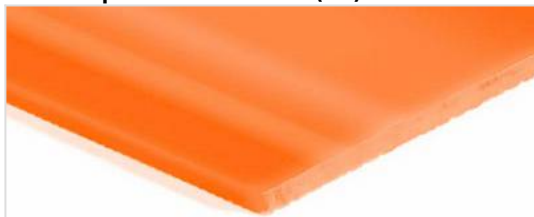
Lato trasporto: Liscio lucido (SG)