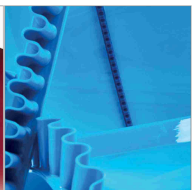
Accessori per nastri trasportatori in PU