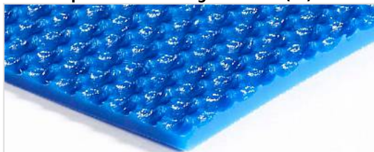
Lato trasporto: Struttura grossolana (RI)