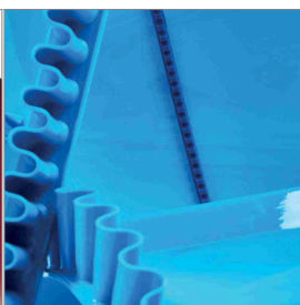
Accessori per nastri trasportatori in PU