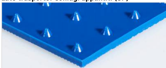
Lato trasporto: Coniugi appuntiti (SP)