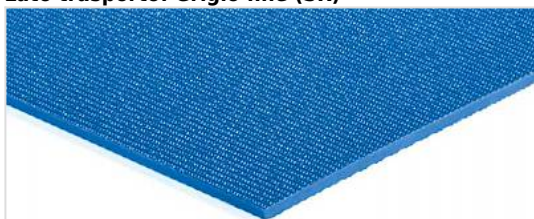
Lato trasporto: Grigio fine (SR)