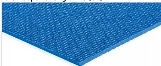
Lato trasporto: Grigio fine (SR)