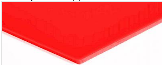
Lato trasporto: liscio (S)