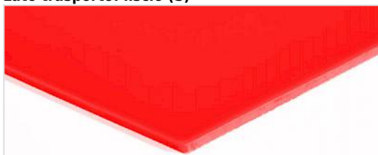
Lato trasporto: liscio (S)