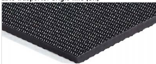
Lato trasporto: Grigio fine (SR)