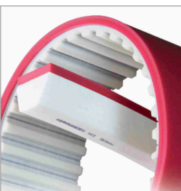
Rivestimenti in PU per cinghie dentate e trapezie