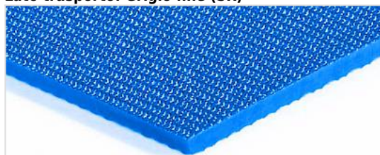
Lato trasporto: Grigio fine (SR)