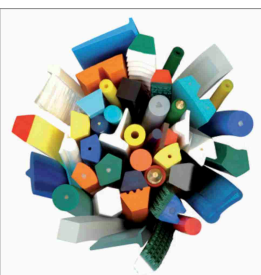
Profili a nastro saldabili in PU e TPE