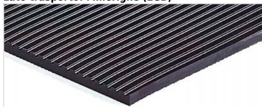
Lato trasporto: Millerighe (LGB)