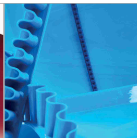
Accessoires de bande en PU