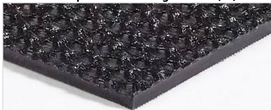
Côté de transport: Structure grossière (RI)