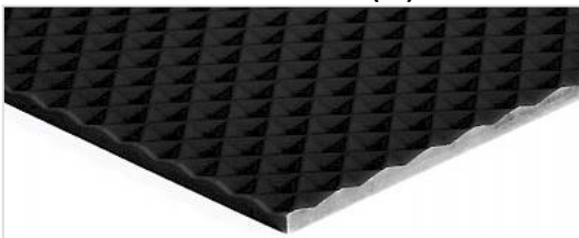
Côté d'entraînement: Diamant (ID)