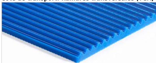
Côté de transport: Rainures transversales (TGA)