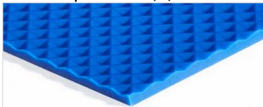
Côté de transport: Diamant (ID)