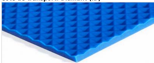
Côté de transport: Diamant (ID)