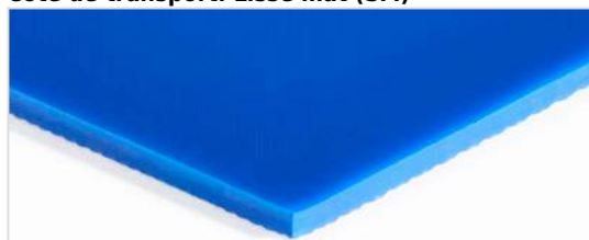
Côté de transport: Lisse mat (SM)