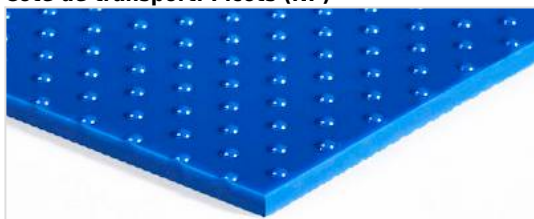
Côté de transport: Picots (NP)