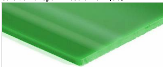
Côté de transport: Lisse brillant (SG)