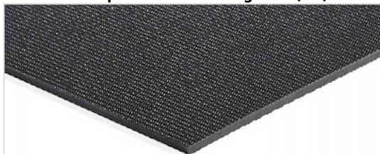
Côté de transport: Finement rugueux (SR)