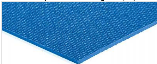
Côté de transport: Finement rugueux (SR)