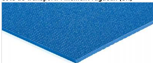
Côté de transport: Finement rugueux (SR)