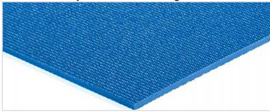
Côté de transport: Finement rugueux (SR)