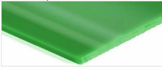
Lado de transporte: Brillante liso (SG)