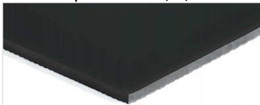
Lado de transporte: Liso mate (SM)