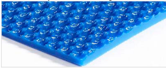
Lado de transporte: Grabado rugoso (RI)