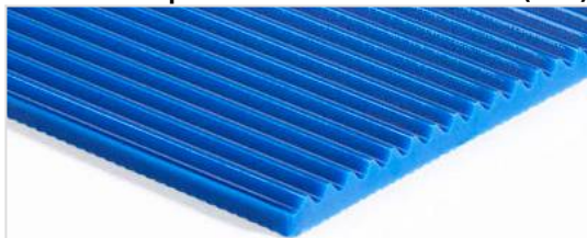
Lado de rodadura: De grano fino (FI)