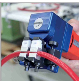
Tecnología de soldadura/unión para PU y TPE