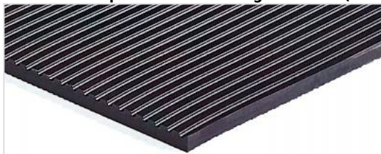
Lado de rodadura: De grano fino (FI)