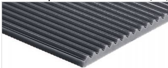
Lado de transporte: Ranuras transversales (TGA)