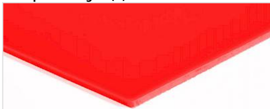
Transportside: glat (S)