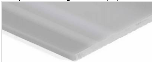
Transportside: Glat og skinnende (SG)