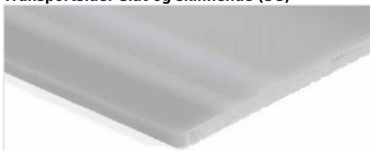
Transportside: Glat og skinnende (SG)