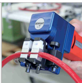
Svejsning/forbindelsesteknik til PU og TPE