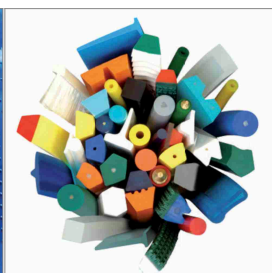
Svařitelné řemeny z PU a TPE