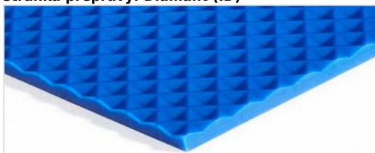
stránka přepravy: Diamant (ID)