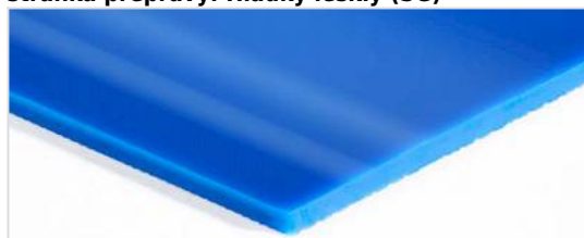
stránka přepravy: Hladký lesklý (SG)