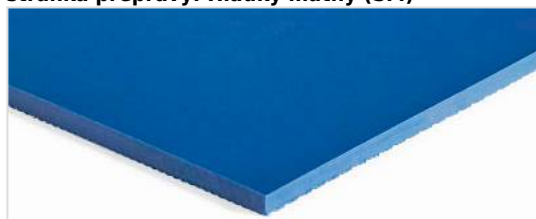
stránka přepravy: Hladký matný (SM)