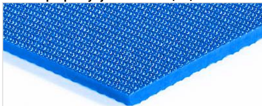
stránka přepravy: jemně hrubé (SR)