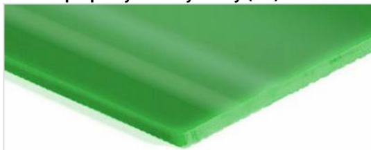
stránka přepravy: Hladký lesklý (SG)